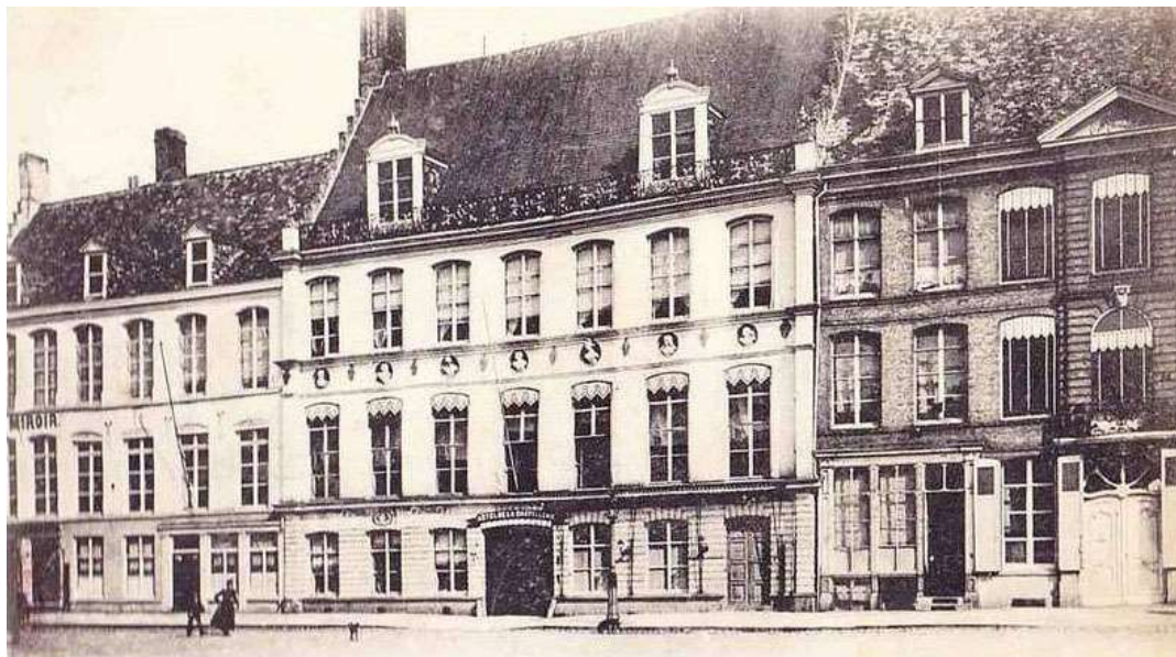
Kasselrijgebouw op de Markt voor de Eerste Wereldoorlog

De processen voor de kamer werden behandeld op de wekelijkse kamerdagen die op zaterdag plaats vonden. Het was dan marktdag in leper. De pleidooien gingen door in de schepenkamer. In 1540-45 was dat in het kasselrijhuis op de Markt 12 . Men sprak van de 'gemene' kamer want de schepenen